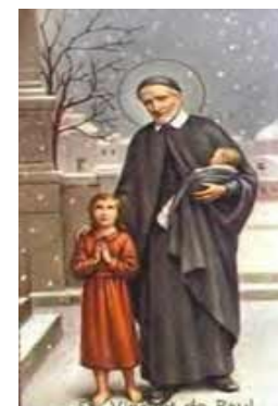
Saint Vincent de Paul