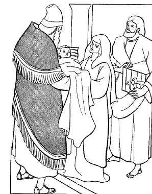
PRESENTATION DU SEIGNEUR AU TEMPLE